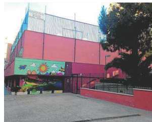
FACHADA DEL CENTRO

Tres aulas de Infantil, una de psicomotricidad, seis de Primaria, cuatro de secundaria, biblioteca, laboratorio de Ciencias, aulas de informática/ multimedia, tecnología, plástica y música, gimnasio, comedor, patios de recreo