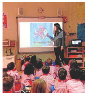
LAS NUEVAS TECNOLOGÍAS ESTÁN INTEGRADAS EN EL COLEGIO RETIRO