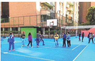
RETIRO CUENTA CON UN SERVICIO DE PERMANENCIA